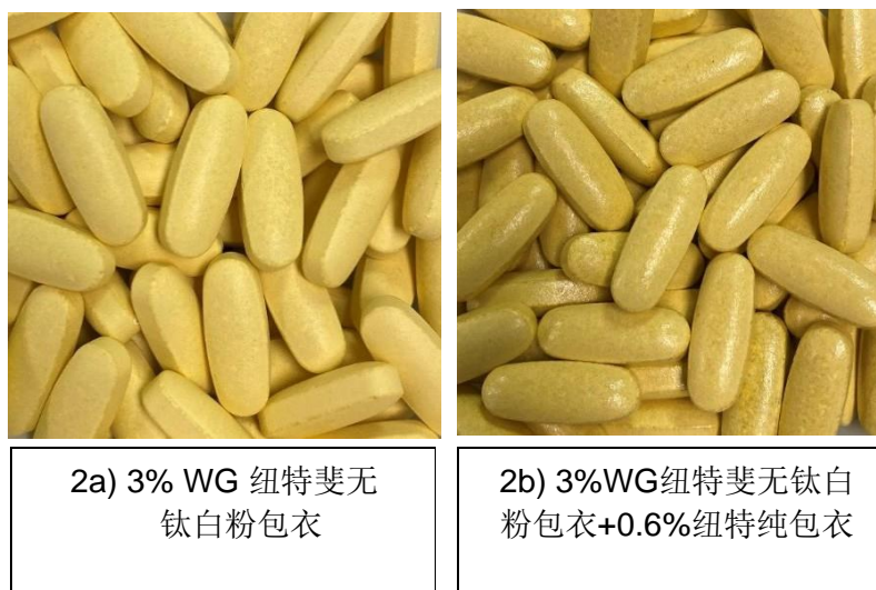
图2a & 2b. a) 纽特斐无钛白粉包衣和 b) 纽特纯包衣后的片剂图像

在#6-7包衣室中，应用纽特纯包衣后取样的最终包衣片剂光滑、颜色一致，毫无缺陷(图2a)。表3显示 \Delta E 值低于1，表明这些片剂的颜色分布均匀。同时，纽特纯的应用使得光泽度值从77增加到167光泽度单位(图2b)。研究发现，纽特斐包衣( \Delta E 和光泽度)和纽特纯包衣(光泽度)期间，在开始、连续和结束阶段之间片剂性能并无差异(表2)。