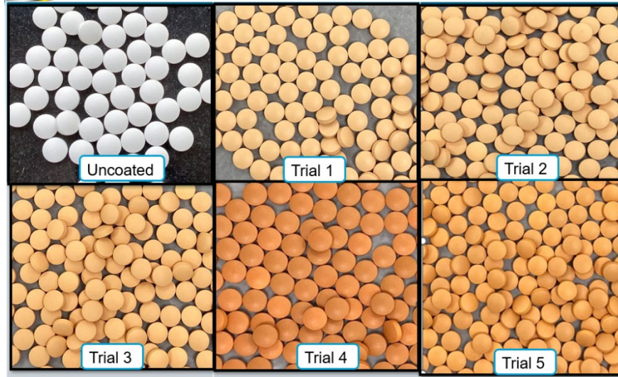
图 1：未包衣片剂 vs 薄膜包衣片剂的外观

西格列汀的含量测定、杂质检测和溶出度测试：在 3 个月加速稳定储存开始和结束时，未包衣和薄膜包衣片剂(试验 1-5)的西格列汀含量均在 95-105%的合格范围内(图 2)。所有薄膜衣片剂在加速 3 个月后，杂质不超过 0.2%(限值为 1%)，这表明欧巴代 TF 薄膜包衣系统不会导致药物降解。在初始和 3 个月的 40°C/75%RH 加速稳定性条件下，所有薄膜包衣片剂的药物释放没有发生明显变化(图 3)。