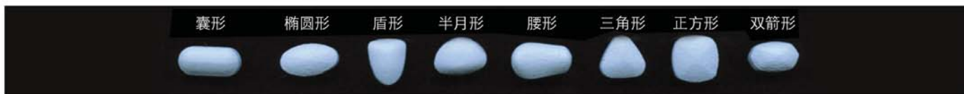
图1: 片剂的形状可以有不同的大小感觉, 同时还可以提高产品的差异化和记忆度