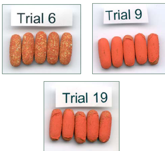
图 1 定性结果 (Trials 6、9 + 19)